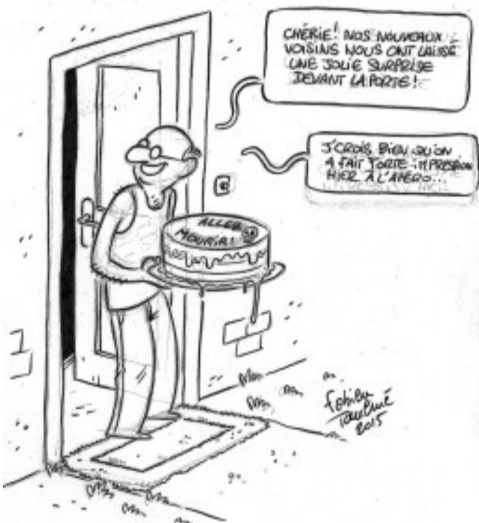
Dessin de Fabien Toulmé. Premier et donc dernier album paru: "Ce n'est pas toi que j'attendais" chez Delcourt.