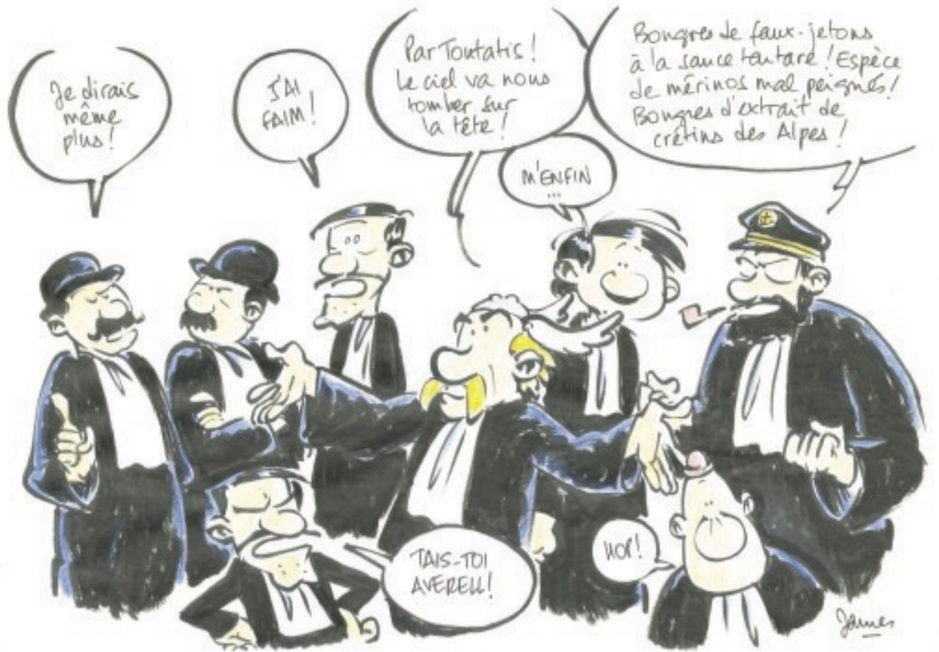
Dessin de James. Dernier album paru: "En toute simplicité, an 2" chez Six pieds sous terre.

Un festival dédié à l'art de bien parler se tiendra en mai. Une première édition sous le signe de la Révolution française. Un, deux, trois... déclamez!